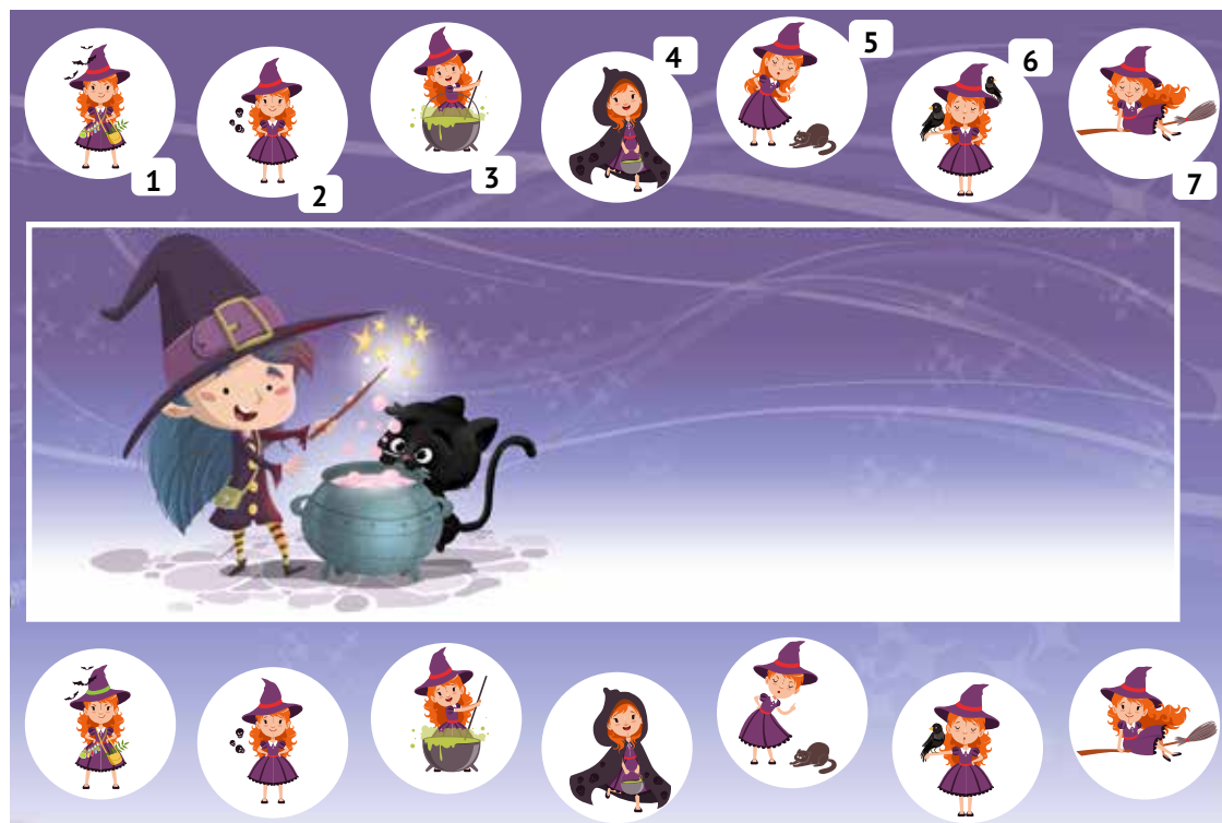
Grafiken: cirodedia, topvectors / Adobe Stock; Montage: SoVD

Auf unserem Bild siehst du sieben Hexen, die sich zum Kräutersammeln im Wald verabredet haben. In der unteren Reihe ist jede Kräuterhexe noch einmal abgebildet. Doch dabei haben sich einige Fehler eingeschlichen: Nur eine Hexe sieht auf beiden Bildern genau gleich aus – kannst du sie finden?