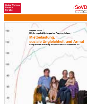
Das Gutachten des SoVD.

Die aktuellen Entwicklungen hat der SoVD bereits damals erkannt und problematisiert. Das Gutachten steht auf der SoVD-Website unter Medien/Broschüren und dort im Abschnitt „Wohnen“.