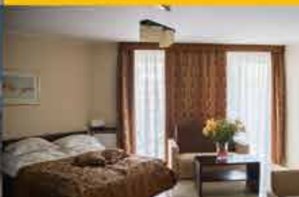
Zimmerbeispiel, 3★ Hotel Avangard Resort