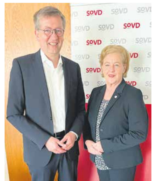
Treffen in der SoVD-Bundesgeschäftsstelle: Michaela Engelmeier und Burkhard Blienert.

Engelmeier traf sich auch mit Burkhard Blienert (SPD). Blienert ist Beauftragter der Bundesregierung für Sucht- und Drogenfragen. Sie sprachen über die Cannabisfreigabe und die Suchtproblematik beim Alkoholkonsum.