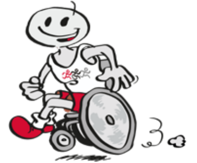
Grafik: Matthias Herrndorff

Derzeit laufen die Planungen für das Rahmenprogramm mit vielen Ständen, Unterhaltung und Gesprächen auf der Bühne. Für die gewohnte Inklusionslauf-Atmosphäre mit gelebter Gemeinschaft und Unterstützung und vor allem viel Spaß auf und neben der Strecke sorgen die Teilnehmenden. str