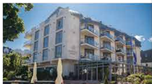
3★ Hotel Avangard Resort