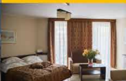
Zimmerbeispiel, 3★ Hotel Avangard Resort