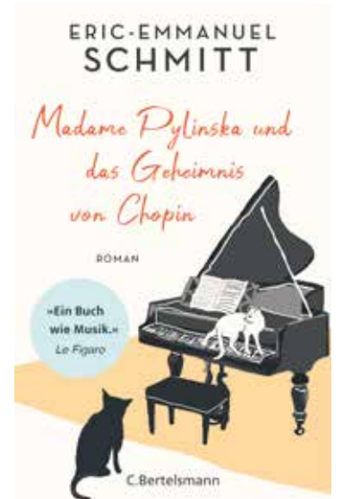
Eric-Emmanuel Schmitt: Madame Pylinska und das Geheimnis von Chopin. C. Bertelsmann, 96 Seiten, ISBN: 978-3-570-10403-3, 16 Euro.

Als Kind hörte Eric erstmals ein Klavierstück von Chopin. Seither lässt ihn dessen Musik nicht mehr los. Doch auch nach Jahren des Klavierunterrichts vermag er dem Instrument nicht jene Klänge zu entlocken, die ihn damals verzauberten. Schließlich bittet Eric die reichlich exzentrische Lehrerin Madame Pylinska um Hilfe. Doch anstatt ihn Klavier spielen zu lassen, mischt sie sich mit ihren kuriosen Unterrichtsmethoden mehr und mehr in seinen Alltag ein. Eric ist alles recht – solange sie ihm hilft, hinter Chopins Geheimnis zu kommen. Doch insgeheim fragt er sich: Lehrt Madame Pylinska ihn wirklich nur das Klavierspiel? Oder nicht vielmehr das Wesentliche des Lebens?