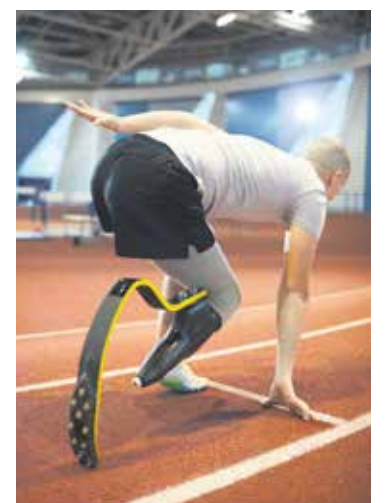
Die DGUV prämiiert Berichte, aber auch großes Engagement im Behinderten- und Rehasport.

Einreichungen sind in fünf Kategorien möglich: Film/Video, Foto, Audio, Artikel und Online-Plattform/Social Media.