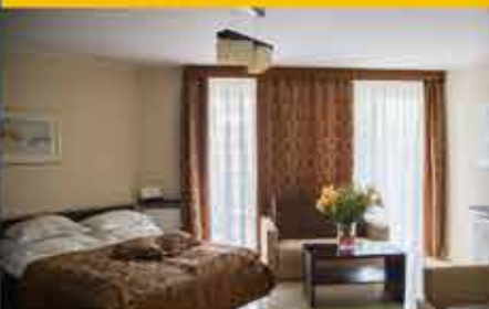
Zimmerbeispiel, 3* Hotel Avangard Resort