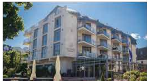
3* Hotel Avangard Resort