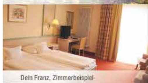
Dein Franz, Zimmerbeispiel