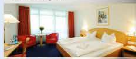
4★Hotel Königshof, Zimmerbeispiel