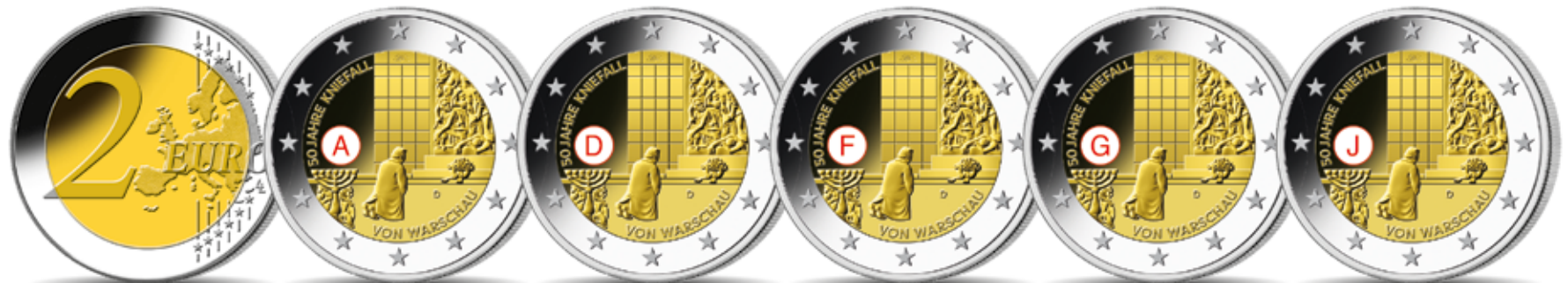
Gemeinsame Rückseite je Ø 25,75 mm