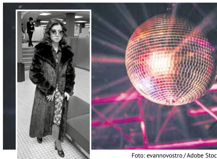
Wer 1974 eine Diskothek besuchte, wusste bald schon wohin die Reise nach dem markanten „Theooo“ von Vicky Leandros ging.