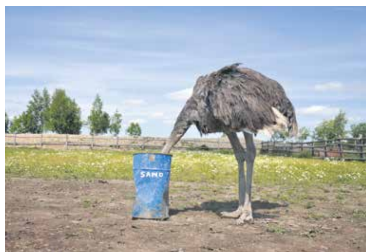
Wie die meisten Tiere rennt auch der Strauß bei Gefahr weg – und das mit einem Tempo von bis zu 90 Kilometern pro Stunde.

Da der Strauß Pflanzen frisst, hält er seinen Kopf naturgemäß häufig in Bodennähe. Hierdurch kann leicht der Eindruck entstehen, er würde diesen vergraben. Das aber käme den langhalsigen Tieren bei einer Bedrohung nicht in den Sinn. Sie würden vielmehr ihr Heil in der Flucht suchen.