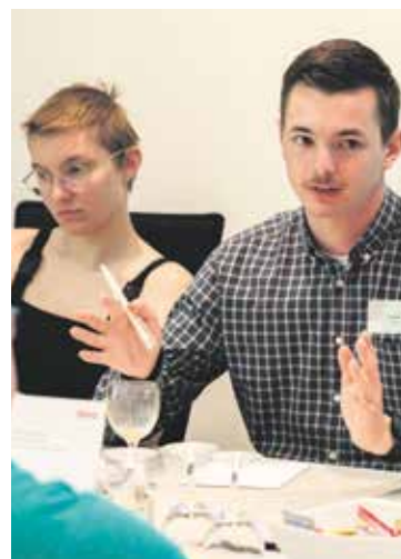
Dabei debattierten auch ganz neue Aktive über Forderungen.