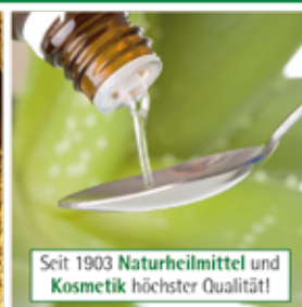
Entwicklung und Herstellung im eigenen Haus