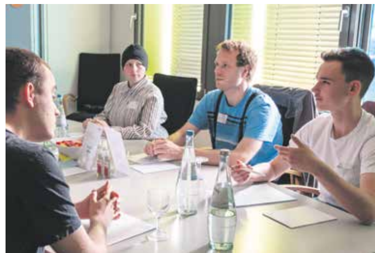
Neben den Diskussionen im Plenum gab es Gruppenarbeit in drei kleineren Themen-Workshops, aus denen man auswählen konnte.