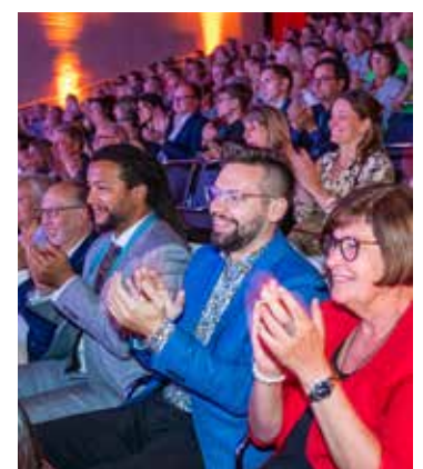
Zahlreiche Gäste fieberten bei der Veranstaltung mit.