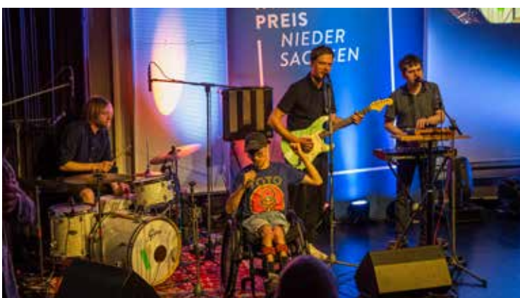
Die inklusive Hamburger Band „Dain Fahrdienst“ begleitete den Veranstaltungsabend und sorgte musikalisch für gute Stimmung.