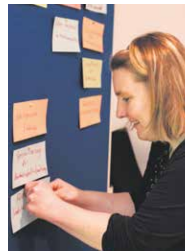
Ergebnisse aus den Workshops fließen in ein Positionspapier.