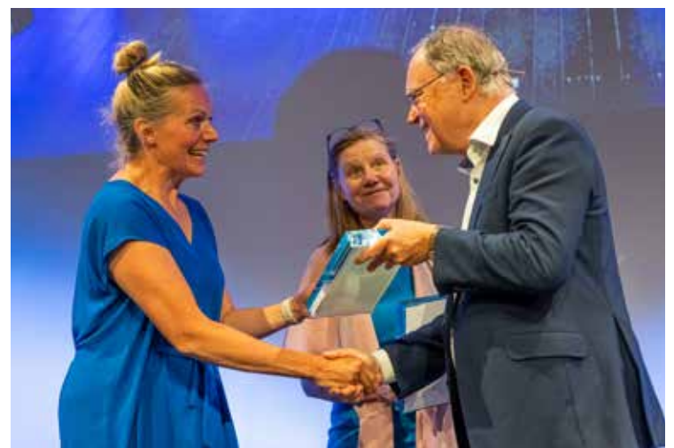
Die Preise an alle Gewinner*innen überreichte der niedersächsische Ministerpräsident Stephan Weil.

Der Inklusionspreis Niedersachsen ist mit insgesamt 19.000 Euro dotiert. Weitere Informationen zum Inklusionspreis und den Preisträger*innen, darunter Filme, die die erstplatzierten Beiträge vorstellen, gibt es unter www.inklusionspreis-niedersachsen.de .