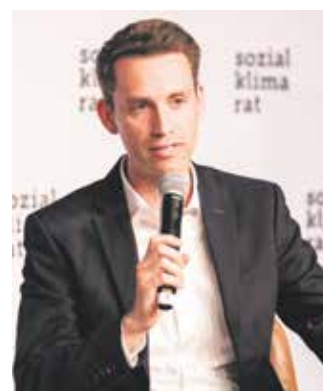
Andreas Audretsch (MdB, Bündnis 90 / Die Grünen)

„Ohne Investitionen wird Klimaschutz nicht funktionieren – man kann nicht alles über den Preis regulieren! (...) Sonst verlieren wir den gesellschaftlichen Zusammenhalt.“