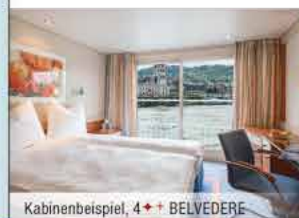
Kabinenbeispiel, 4++ BELVEDERE