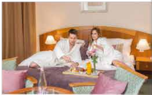
Zimmerbeispiel, 4+ Palace Hotel Hévíz

Freizeit/Kur/Unterhaltung: Erholung pur verspricht ein Besuch des hoteleigenen Wellnessbereichs mit Erlebnisbad (ca. 30°C), Whirlpool (ca. 34°C), Sauna, Dampfkabine und Fitnessraum. Auf der Sonnenterrasse können Sie im Anschluss die Seele baumeln lassen und sich rundum entspannen. In der hoteleigenen Therapieabteilung werden Ihnen neben klassischen Massagen auch Kur-Anwendungen wie Elektrotherapie, Schlamm-packungen und vieles mehr angeboten.