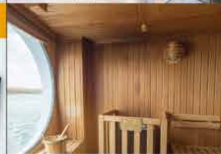
Sauna, 4++ BELVEDERE