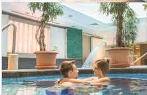
Schwimmbad, 4+ Palace Hotel Hévíz