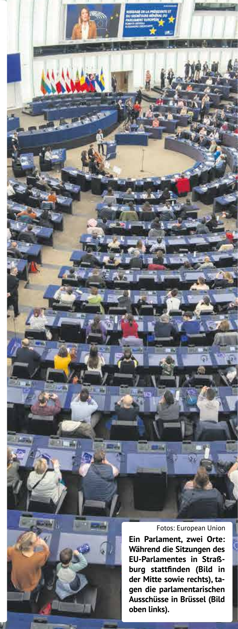
Ein Parlament, zwei Orte: Während die Sitzungen des EU-Parlamentes in Straßburg stattfinden (Bild in der Mitte sowie rechts), tagen die parlamentarischen Ausschüsse in Brüssel (Bild oben links).

Die vollständige Teilhabe von Menschen mit Behinderungen in allen Bereichen des gesellschaftlichen Lebens ist ein zentrales Anliegen unseres Europawahlprogramms. Wir streiten für eine inklusive Gesellschaft, in der die Rechte und die Würde von Menschen mit Behinderungen geachtet und gefördert werden, der Zugang zu Arbeits- und Bildungsmöglichkeiten verbessert und eine vollständige Teilhabe am gesellschaftlichen Leben ermöglicht wird: Wir treiben die Umsetzung der 5. EU-Gleichstellungsrichtlinie voran. Sondereinrichtungen für Menschen mit Behinderung wollen wir abschaffen. Wir streiten für ein inklusives Bildungssystem und einen inklusiven Arbeitsmarkt mit gesetzlichem Mindestlohn für Menschen mit Behinderung. Wir unterstützen das Recht auf selbstbestimmtes Wohnen und Leben. Barrierefreiheit soll in Kommunen, ÖPNV und Privatwirtschaft verpflichtend sein. Auch digitale Barrierefreiheit und barrierefreie Kommunikation muss gewährleistet sein. Wir wollen einen europäischen Behindertenausweis. Wir wollen inklusive Strukturen schaffen und Teilnahme an demokratischen Prozessen ermöglichen. Dafür müssen auch technische Mittel für die Wahrnehmung des Wahlrechts bereitstehen. Diskriminierungen in Rechtsverfahren müssen aufgehoben werden.