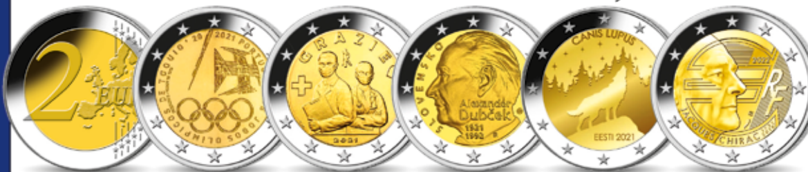
Gemeinsame Rückseite Ø je 25,75 mm 2-Euro Portugal „Olympiade“ 2-Euro Italien „Grazie“ 2-Euro Slowakei „Alexander Dubček“ 2-Euro Estland „Wolf“ 2-Euro Frankreich „Jacques Chirac“