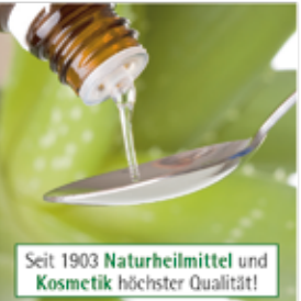
Entwicklung und Herstellung im eigenen Haus