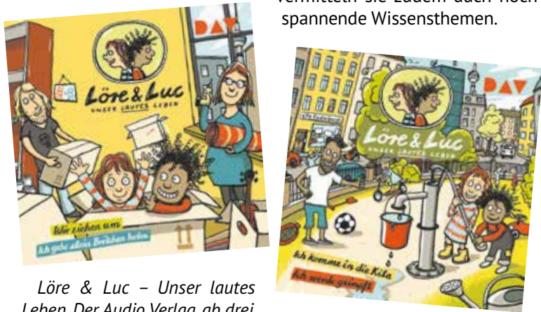
Löre & Luc – Unser lautes Leben. Der Audio Verlag, ab drei Jahren. CD 1 (ISBN: 978-3-7424-2287-3) und CD 2 (ISBN: 978-3-7424-2289-7) mit jeweils zwei Folgen, je 12 Euro.

Bei Löre Krachbein ist immer etwas los! Egal, ob gerade der erste Tag in der Kita, ein Umzug oder ein Arztbesuch ansteht – Löre stellt sich mit Begeisterung den Herausforderungen des Alltags. Und wenn es doch mal schwierig wird, dann ist ihr Freund Luc für sie da. Frech und unterhaltsam schildern die Hörspiele die großen und kleinen Abenteuer der Kindheit. Rund um Familie und Freundschaft vermitteln sie zudem auch noch spannende Wissensthemen.