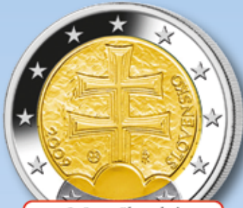
2-€uro Slowakei „Staatswappen“