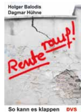
So kann es klappen DVS

Hühne und Balodis fordern, die gescheiterte Riester-Rente abzuschaffen und sich künftig auf eine effektive und nicht gewinnorientierte Rente zu konzentrieren. Das käme letztlich