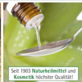
Seit 1903 Naturheilmittel und Kosmetik höchster Qualität!