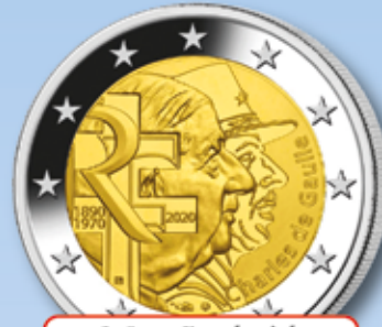
2-€uro Frankreich „Charles de Gaulle“