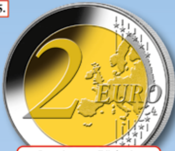
Gemeinsame Rückseite Ø je 25,75 mm