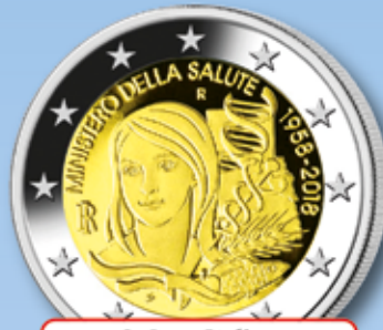
2-€uro Italien „Gesundheitsministerium“