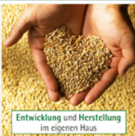
Entwicklung und Herstellung im eigenen Haus