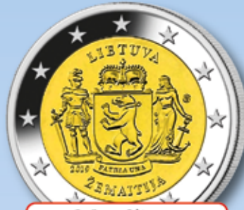
2-€uro Litauen „Region Zemaitija“