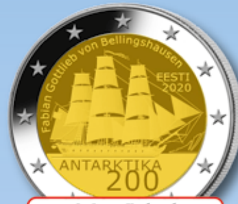
2-€uro Estland „200 J. Entdeckung Antarktis“