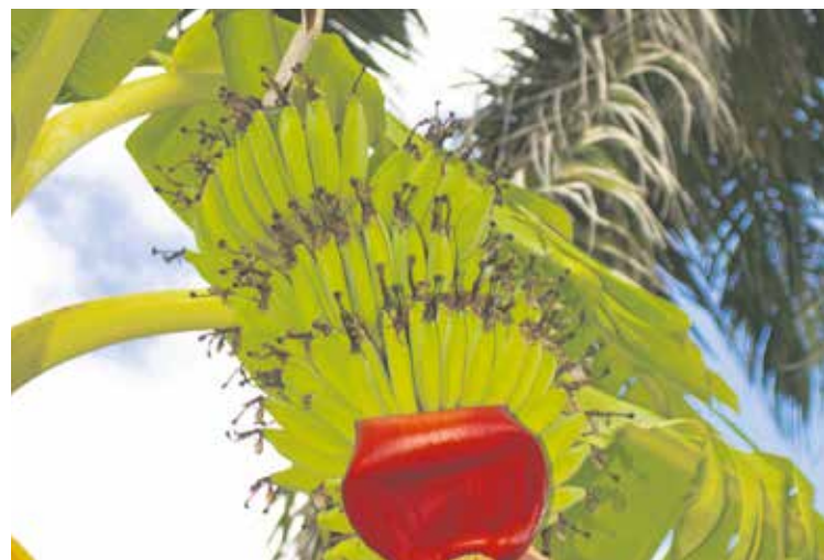
Was hat die Natur sich wohl dabei gedacht? Sieht aus wie eine Banane, verhält sich dann aber doch wie eine Kartoffel.

In Supermärkten kann man Kochbananen das ganze Jahr über kaufen. Sie werden übrigens auch von Menschen getragen, die auf Gluten allergisch reagieren. Ein weiterer Vorteil ist, dass unreife Kochbananen sich gut zu Mehl verarbeiten lassen, das dann zum Beispiel als Soßenbinder dient.