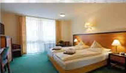
Zimmerbeispiel, 3+ Hotel Summerhof