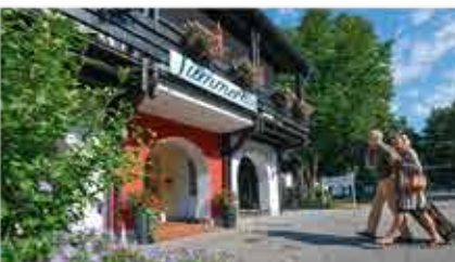
3+ Hotel Summerhof