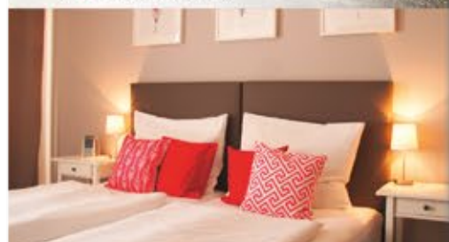
Zimmerbeispiel, 3+ Hotel Dein Franz