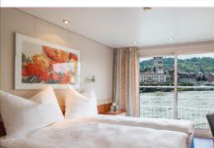
Kabinenbeispiel, 4+ BELVEDERE