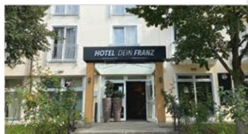
3+ Hotel Dein Franz

Freizeit/Kur/Unterhaltung: Die hauseigene Physiotherapiepraxis bietet Ihnen gegen Aufpreis erholsame und wohltuende Anwendungen. Oder Sie nutzen den Fahrradverleih (gg. Gebühr) im Hotel, um das herrliche Rottaler Bäderdreieck aktiv zu erkunden.