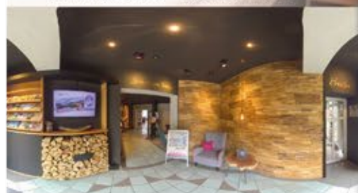
Eingangsbereich, 3+ Hotel Dein Franz