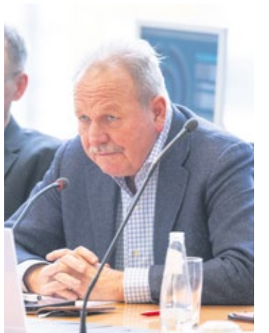
Frank Bsirske (Die Grünen): „Wir wollen uns einmischen bei der Zukunftsgestaltung. (...) Bei einer Orientierung an 60 Prozent des Einkommenmedians wäre der Mindestlohn armutsfest.“