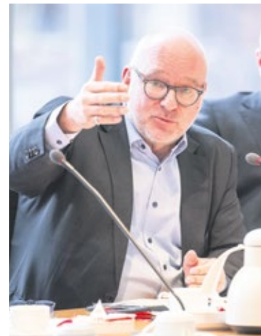
Matthias W. Birkwald (Die Linke): „Dieses Land soll und muss sozialer werden. Die Forderungen des SoVD für die Rente und für Menschen in Erwerbsminderungsrenten unterstütze ich sehr.“