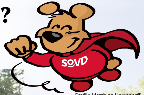
Grafik: Matthias Herrndorff

Das freiwillige Engagement seiner Mitglieder trägt den SoVD. Sie sind das Rückgrat der Orts- und Kreisverbände. Auch in diesem Jahr zeichnet der SoVD seine „Superheld*innen des Jahres“ aus und ehrt Mitglieder, die sich besonders verdient gemacht haben. Vorschläge können über das Formular oder digital eingereicht werden.