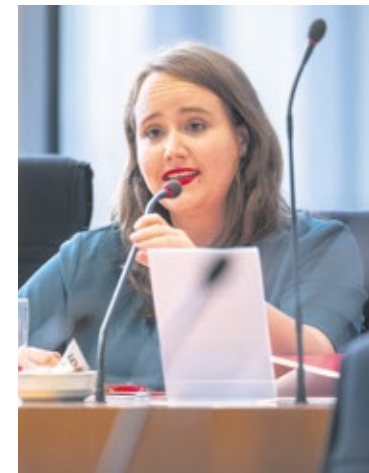
Ricarda Lang (Die Grünen): „Die nächste Regierung muss eine Reform der Schuldenbremse auf den Weg bringen, die auch im Bereich frühkindlicher Bildung mehr Investitionen ermöglicht.“