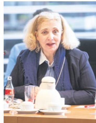
Dr. Daniela de Ridder (SPD): „Viele Frauen sind unfreiwillig in Teilzeitschichtverhältnissen – sie würden gerne mehr arbeiten – auch weil mehr Verdienst zu mehr Rente führt.“