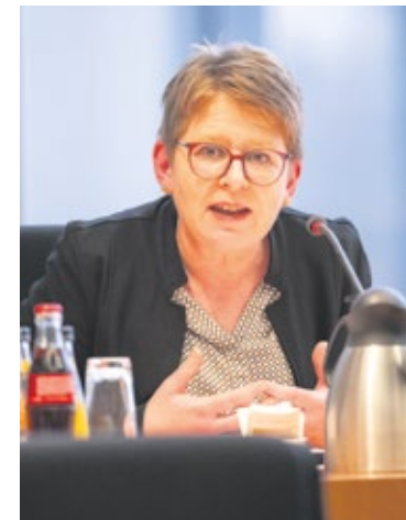
Dr. Tanja Machalet (SPD): „Es wird leider viel zu wenig über das geredet, was die Menschen eigentlich brauchen: eine stabile Gesundheitsversorgung und eine stabile Rente.“