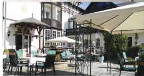
Terrasse, 3+ Schlosshotel Marienbad