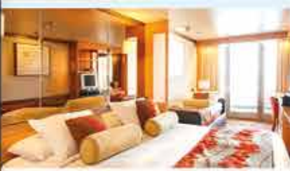
Außenkabine mit Balkon, 4+ VASCO DA GAMA

Bremerhaven – Edingburgh – Belfast – Plymouth – Dover – Bremerhaven 09.08.-23.08.2022 15 Tage ab € 2.837,- p.P.