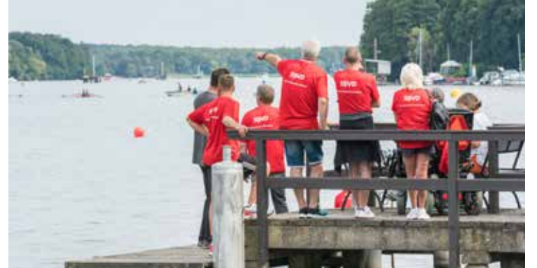
Beim „tag des wir“ steht gemeinsames Erleben im Vordergrund.

gemeinsamer Stammtisch oder Hindernisparcours – Fantasie ist gefragt, wenn es um das Miteinander in Aktion geht. Für Ideen kann außerdem die vom SoVD herausgegebene Ideenbroschüre „Hand in Hand“ dienen, die wir Ihnen gerne auf Anfrage zusenden und die Sie sich unter www.sovd.de/broschueren bei „Ehrenamt“ herunterladen können.