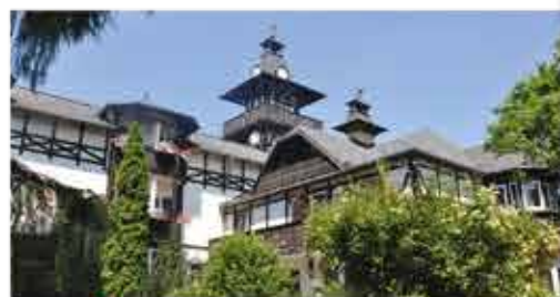
3+ Schlosshotel Marienbad

Freizeit/Kur/Unterhaltung: Wohltuende Kur-Anwendungen, wie bspw. Massagen, Moorpackungen, Elektro- und Magnettherapie, werden Ihnen in der hauseigenen Kur-Abteilung angeboten.