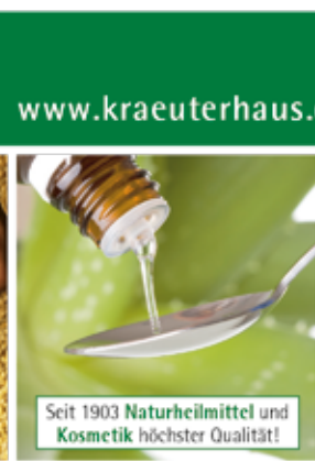
Entwicklung und Herstellung im eigenen Haus