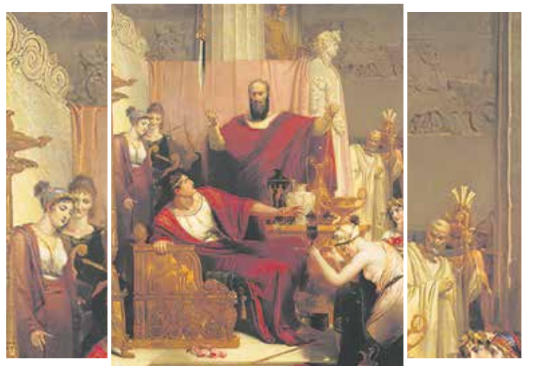
Richard Westalls Gemälde „Das Schwert des Damokles“ (1812).

Dionys von Syrakus gehörte zu den mächtigsten Herrschern der Antike. Viele neideten ihm seine Macht, so auch der Höfling Damokles. Dem Emporkömmling wollte Dionys der Sage nach eine Lehre erteilen und überließ ihm hierfür seinen Platz an der Tafel. Über dem Stuhl aber ließ der Potentat an einem dünnen Faden ein Schwert aufhängen. Auf diese Weise wollte Dionys die Gefahren verdeutlichen, die eine derart mächtige Position mit sich bringt. Bekanntheit erreichte diese Begebenheit auch als „Schwert des Damokles“.