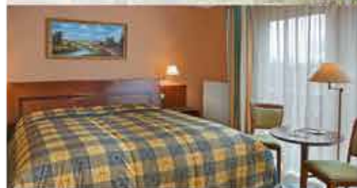
Zimmerbeispiel, 3+ Schlosshotel Marienbad