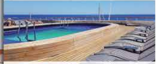
Oasis Pool, 4+ VASCO DA GAMA

Weitere Informationen im neuen Katalog 2022 – Jetzt anfordern!