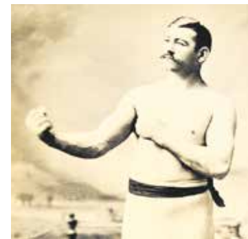
John L. Sullivan (1858–1918) erlebte eine herbe Niederlage.