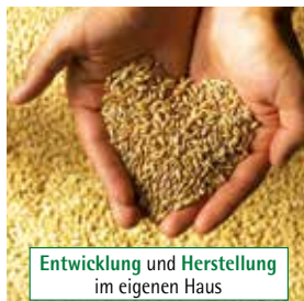
Entwicklung und Herstellung im eigenen Haus