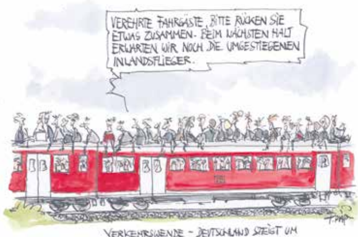
Karikatur: Thomas Plaßmann

Er wird die Debatte im Sinne der Betroffenen weiterhin aufmerksam begleiten. veo