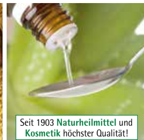
Seit 1903 Naturheilmittel und Kosmetik höchster Qualität!