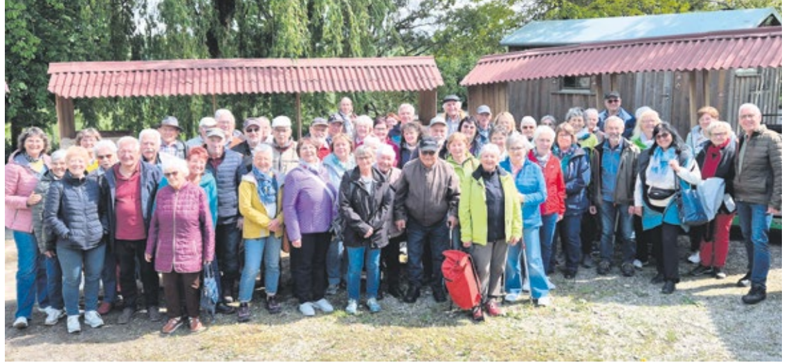
Eine Menge Mitglieder und Gäste hatten sich zum Tagesausflug des SoVD Neukirch eingefunden.

Auf der Rückseite des Anwesens wartete bereits ein besonderes Highlight: eine Fahrt mit dem „Apfelzügle“ durch Wiesen und Obstplantagen. Während der lustigen Rundfahrt in dem Spezialfahrzeug erhielten die Teilnehmenden interessante Einblicke in den Obstanbau, die regionale Landwirtschaft und die Entstehung des heute so beliebten Apfels, der über die Seidenstraße noch als kleine und gar nicht schmackhafte Frucht zu uns an den Bodensee kam. Auch Historisches über Grafschaften und Kirche sowie