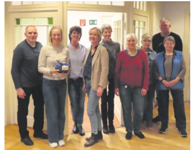
Ortsverband St. Margarethen

Nachdem der Ortsverband wegen „Personalmangel“ kurz vor der Auflösung stand, konnten dank einer Welle der Solidarität auf der Jahreshauptversammlung am 27. Februar alle Vorstandsposten besetzt werden. Als neuer 1. Vorsitzender