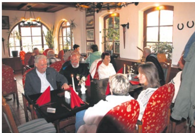
Zum Mittagessen gab es neben den Speisen auch einen lebhaften Austausch über Zukunftsängste und die aktuelle Politik.

Das Leitungswasser in Deutschland ist ein unbedenklicher Durstlöcher