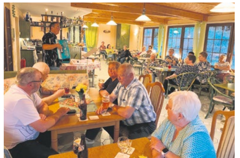
Neben den Tagesausflügen wurde den Berzhahner SoVDler*innen auch ein Musikabend geboten.

Der SoVD-Ausflug war geprägt von abwechslungsreichen Ausflügen, guter Verpflegung, viel Natur und herzlicher Gemeinschaft, die noch lange in Erinnerung bleiben werden.