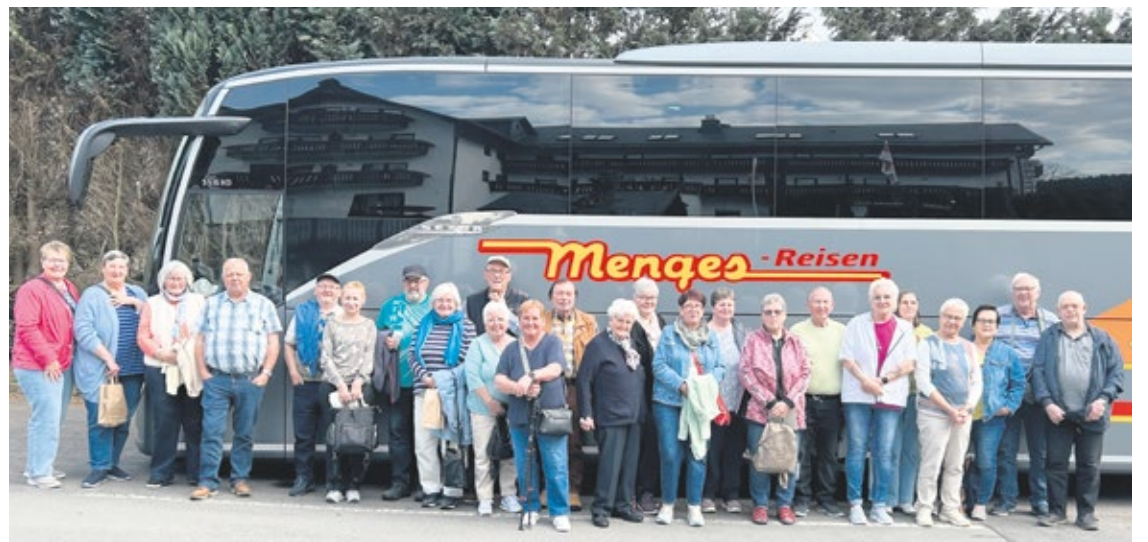
Die Reisegruppe aus Berzhahn genoss ein abwechslungsreiches Programm während ihrer Reise.

Im Jahr 2025 gab es insgesamt 1.038 Unfälle mit Personenschaden, an denen eine Person zu Fuß und eine Person auf einem Pedelec beteiligt waren. Bei weiteren 3.399 Unfällen war jeweils eine Person zu Fuß und eine Person auf einem Fahrrad ohne Hilfsmotor beteiligt. Dabei kam es bei den Pedelec-Unfällen etwas häufiger zu Verletzungen der Beteiligten: In diesen Fällen kamen auf 100 Unfälle mit Personenschaden im Schnitt 16 Schwerverletzte und 119 Leichtverletzte. Getötet wurde niemand. Bei Kollisionen mit Fahrrädern ohne Hilfsmotor kamen auf 100 solcher Unfälle 0,2 Getötete, 14 Schwer- und 110 Leichtverletzte. Quelle: Destatis