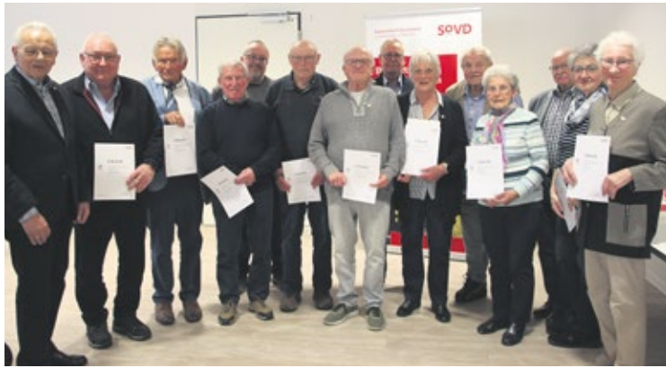
Ortsverband Dörentrup Ehrungen