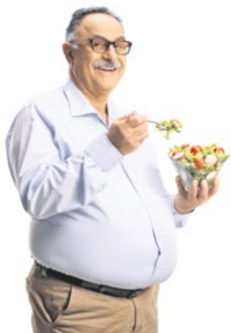
Mit dem Coaching soll auch die Lust auf gesundes Essen geweckt werden.

Die Diagnose Adipositas wird bei starkem Übergewicht und einem Body-Mass-Index von mindestens 30 kg/m 2 gestellt.