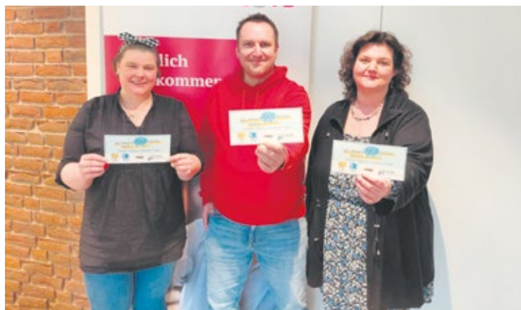
Ortsverband Kirchspiel Medelby