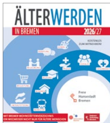
Grafik: Möhlenkamp & Schuldt / Kellner Verlag / Freie Hansestadt Bremen