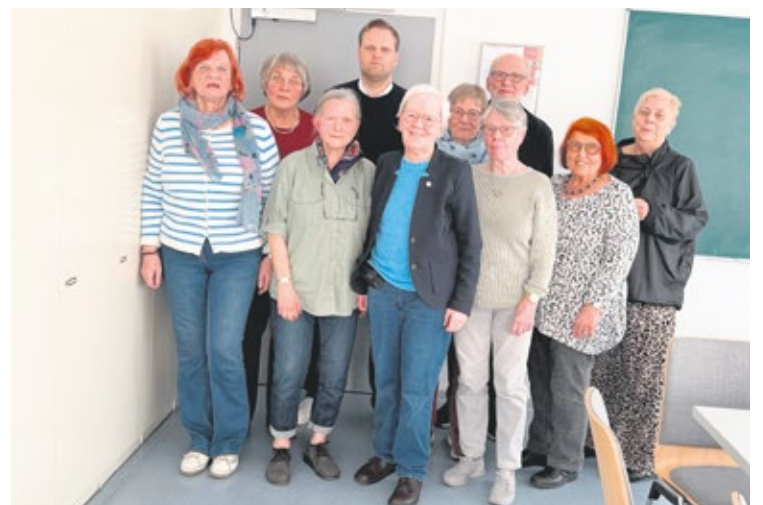
Ortsverband Dortmund Ost West