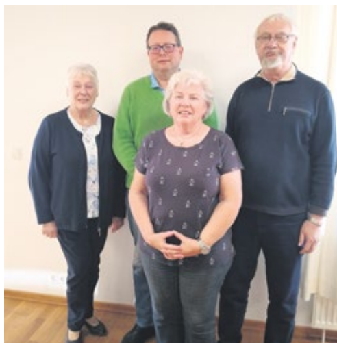
Ortsverband Wentorf bei Hamburg