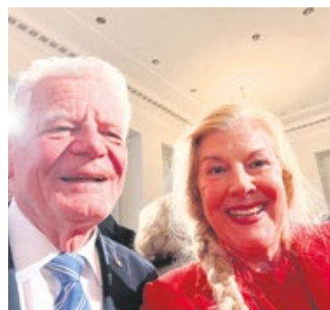
Meta Günther mit dem ehemaligen Bundespräsidenten Joachim Gauck.

Die BayernTourNatur 2026 ist gestartet und bietet bis zum Herbst eine große Zahl von Naturführungen an